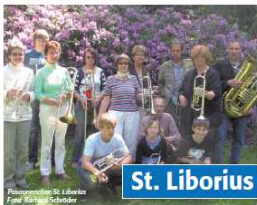
Posaunenchor St. Liborius