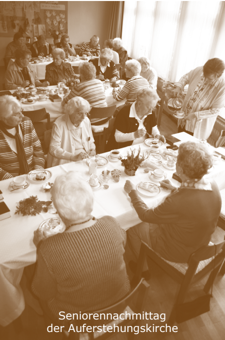
Seniorenachmittag der Auferstehungskirche