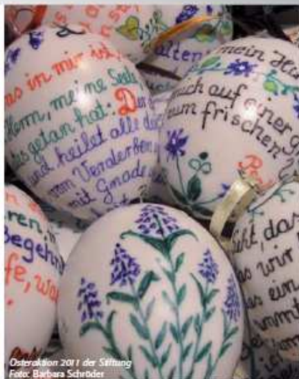
Osteraktion 2011 der Stiftung