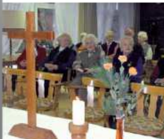
Andacht im Seniorenheim am Hang