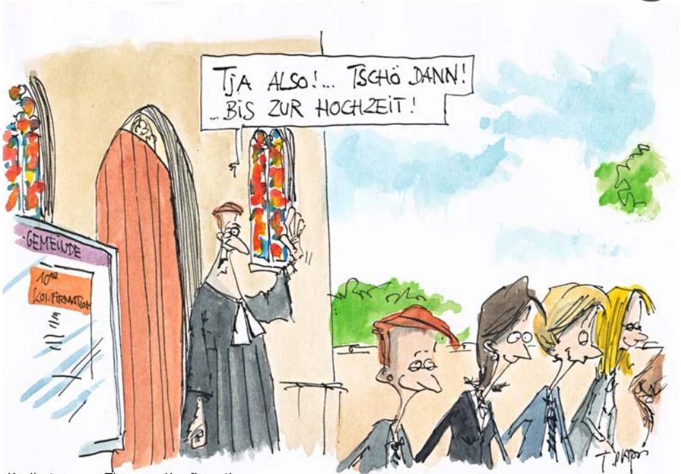
Karikatur zum Thema „Konfirmation“ von Thomas Plaßmann