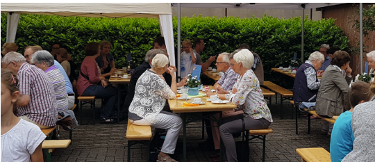
Kaffee und Kuchen im Innenhof des Ludwig-Harms Hauses

Getränke, gebackene Orgelpfeifen und Käsespieße, dazu heitere Lieder