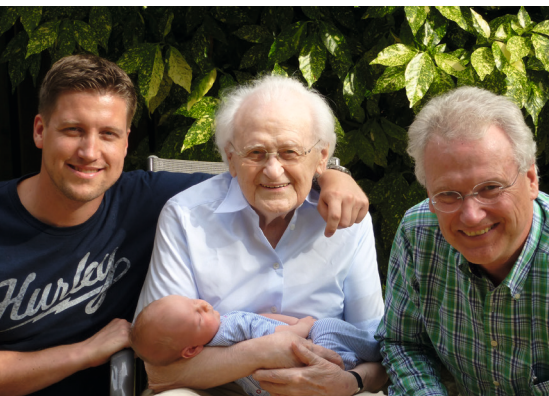
Vier Generationen - Der Lauf des Lebens

Die Natur zeigt uns, dass der Sommer bald vorüber ist und der Herbst naht. Der Kalender legt den Herbstanfang fest und wir wissen, dass wir uns vom Sommer verabschieden müssen. Nicht immer einfach, denn wer wetterfühliger ist und die Kälte hasst, weiß, wovon die Rede ist.