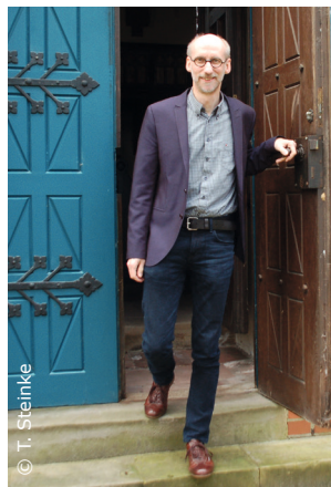
Thomas Steinke möchte mit Interessierten aus der Kirchentür treten und neu die Begegnung mit Menschen aus dem eigenen Umfeld suchen.