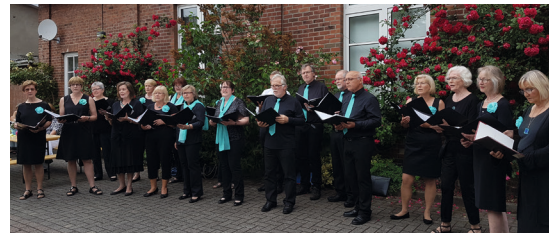
Gemischter Chor Bremervörde

Sie können die Sanierung unserer Orgel mit Ihrer Spende auf folgendes Konto unterstützen: Kirchenamt Stade - Sparkasse Rotenburg/Bremervörde: IBAN: DE44 2415 1235 0000 1108 82 - BIC: BRLADE21ROB Verwendungszweck: St. Liborius Orgelsanierung Vielen Dank für Ihre Hilfe!