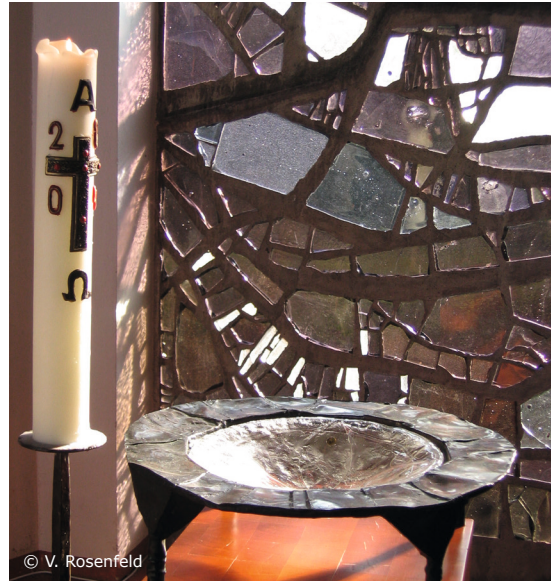
Das Taufbecken in der Auferstehungskirche.

Die Erinnerung an die Taufe gilt in diesem Gottesdienst besonders den Kindern. Zugleich mit den Kindern werden auch die Erwachsenen dazu angeregt, sich der Taufe als Ereignis