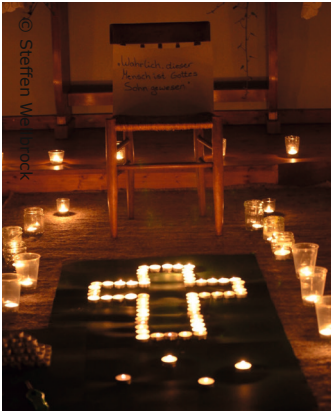
„Wahrlich, dieser Mensch ist Gottes Sohn gewesen“. - Jugendosternacht 2019