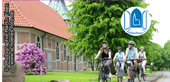
Mit dem Fahrrad auf dem „Mönchsweg“ unterwegs.

Brauchen Sie eine Auszeit, wollen entschleunigen, sich auf Sinnsuche begeben oder gemeinsam in einer Gruppe die Freude an der Bewegung genießen? Ganz in Ihrer Nähe gibt es einen wunderbaren Radfernweg! Der Mönchsweg verläuft von Bremen über Zeven, Stade und das Alte Land nach Wischhafen. Nach der Elbüberquerung mit der Fähre führt der Weg ab Glückstadt quer durch Schleswig-Holstein bis nach Puttgarden auf Fehmarn. Verschiedenste Landschaften mit ihren religiösen und kulturellen Orten sind wie gemacht für eine Reise mit Leib und Seele. In Deutschland verbindet der Mönchsweg über 100 Kirchen sowie viele kulturelle und landschaftliche Höhepunkte miteinander. Der Mönchsweg bietet viele Möglichkeiten, eine erlebnisreiche Woche, ein Wochenende oder eine fröhliche Tagestour auf dem Rad zu verbringen. Eine Broschüre mit Unterkunftsverzeichnis wird kostenfrei zur Verfügung gestellt. Übernachtungsmöglichkeiten bieten neben Jugendherbergen, Campingplätzen und Pilgerquartieren auch Pensionen,