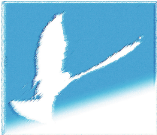
Die weiße Taube gilt als Sinnbild für den Heiligen Geist und steht für Sanftmut, Reinheit und Frieden. Grafik: Pfeffer

Viele Menschen freuen sich auf Pfingsten, ohne die eigentliche Bedeutung des Pfingstfestes zu kennen. Arbeitnehmer und Schulkinder freuen sich auf die freie Zeit, die sie mit der Familie oder mit Freunden verbringen können oder in der sie ihren Freizeitinteressen nachgehen können. Auch wird die arbeitsfreie Zeit mittels sogenannter Brückentage für einen Kurzurlaub genutzt, um sich zu erholen und neue Eindrücke sammeln zu können.