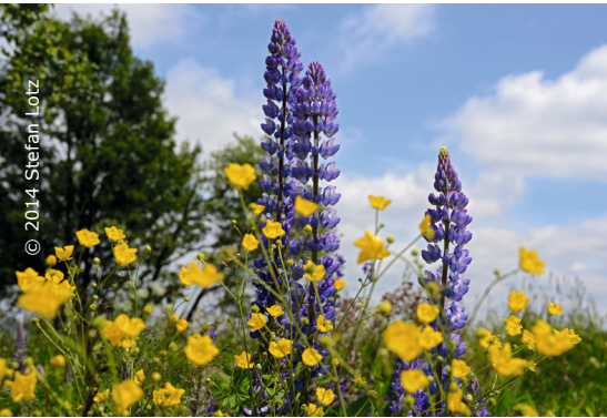
Entdecken Sie Gottes Schöpfung in der Natur.

„Geh aus, mein Herz...“ unter diesem Motto findet in diesem Jahr das Sommerkonzert des Chores und des Blockflötenensembles der Auferstehungskirche am Freitag, dem 14. Juni in der Auferstehungskirche um 19.00 Uhr statt. Wer kennt sie nicht, die wunderschönen Strophen des Liedes von Paul Gerhardt, die einfühlsam und mit Freude und Respekt vor der