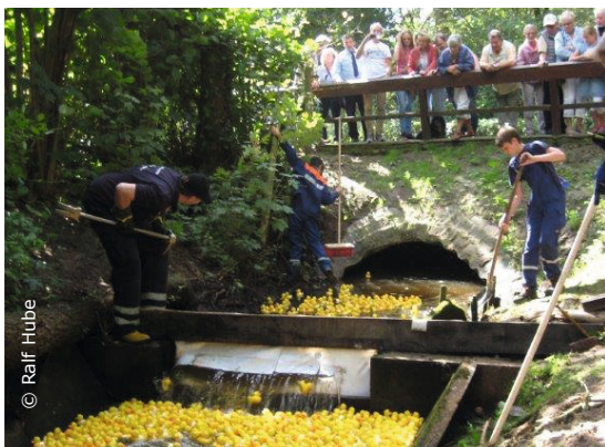
Start der Enten mit freundlicher Unterstützung der Jugend-/Freiwilligen Feuerwehr Bremervörde.

Im Rahmen des vierten „Vörder Seefestes“ veranstaltet die Kirchenstiftung „Pro Liborius & Auferstehung“ zum dritten Mal das beliebte Entenrennen.