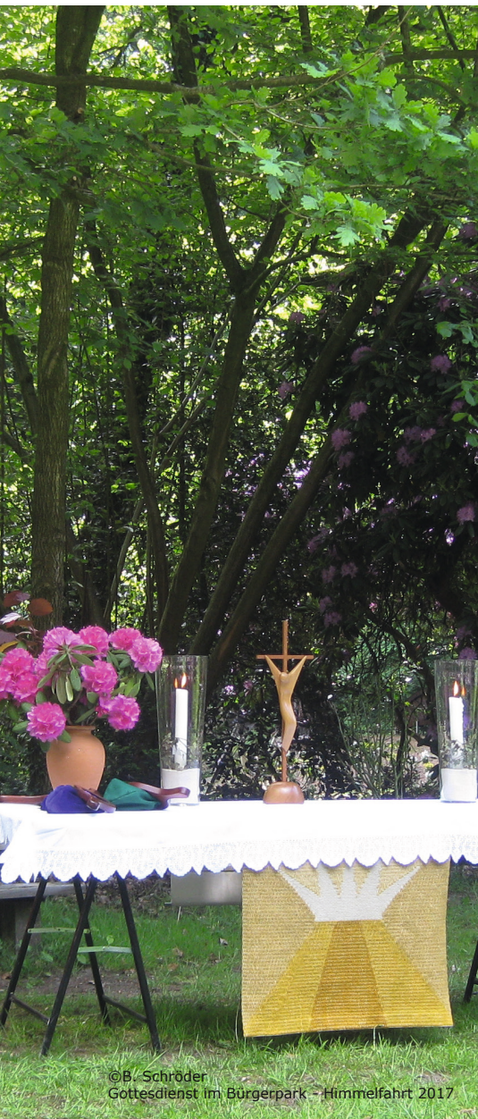
Gottesdienst im Bürgerpark - Himmelfahrt 2017

Aus Gründen des Datenschutzes veröffentlichen wir in der Internetausgabe personenbezogene Daten nicht.