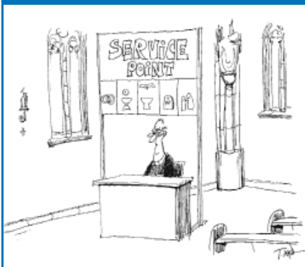
© Grafik: Plaßmann Gemeindebrief - Magazin für Öffentlichkeitsarbeit