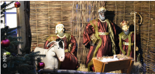
Die „lebendige Krippe“ vor dem Ludwig-Harms-Haus

Über Jahrzehnte gab der Rathausmarkt den Rahmen für den Weihnachtsmarkt in Bremervörde. Doch aus Gründen der Planungssicherheit kehrte er nun im Jahr 2018 an die St. Liborius-Kirche zurück. So herrschte am zweiten Adventswochenende, trotz Wind und Nässe, reges Treiben an den Buden rund um Kirche und Gemeindehaus. Musik, Kinderlachen und der Duft von Keksen, Glühwein, Bratwurst und offenem Feuer lagen in der Luft. Auch die lebendige