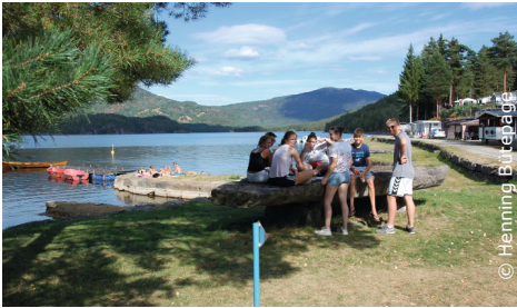
Gemeinschaft erleben - von den Erfahrungen anderer profitieren