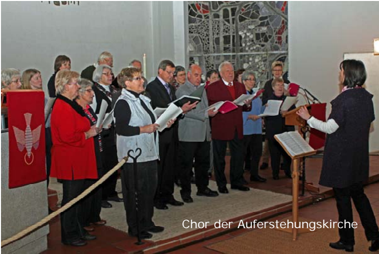
Chor der Auferstehungskirche

Sätzen aus dem 20. Jahrhundert. Im Laufe des Jahres gestalten wir Gottesdienste an entsprechenden