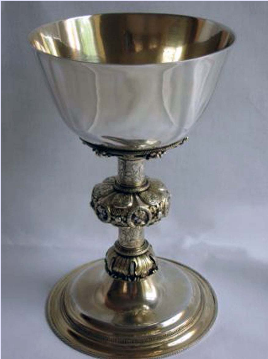
Abendmahlskelch aus dem Jahre 1535