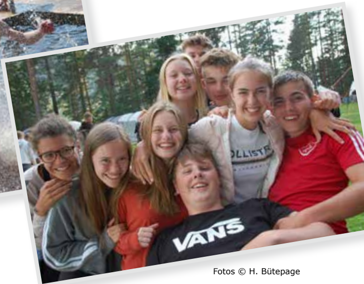
Fotos von der Sommerfreizeit 2014 in Schweden