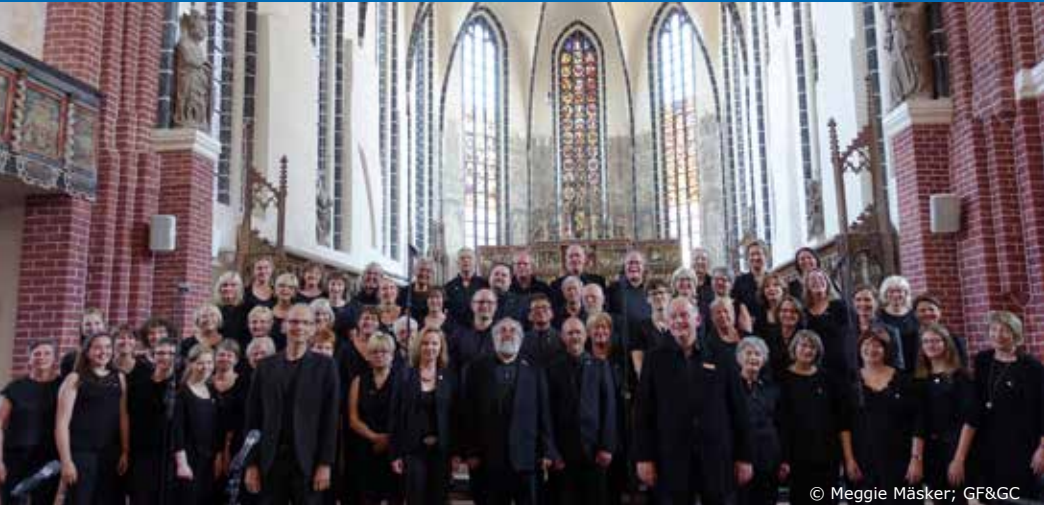
Der German Folk & Gospel Choir in der Marienkirche zu Salzwedel 2019