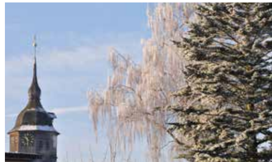
Kirchturm St. Liborius