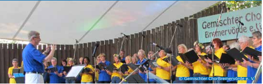
Der „Gemischte Chor Bremervörde e.V.“ bei einem Auftritt auf der Seebühne am Vörder See (2019)