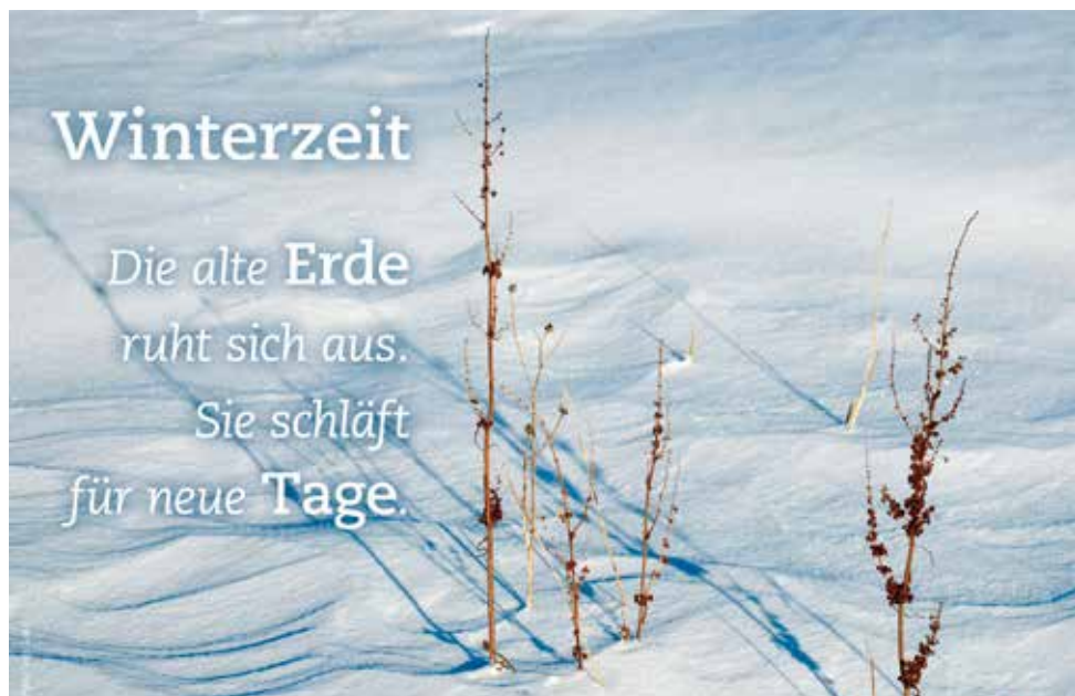
© Foto/Text: Lotz, „Gemeindebrief“, Magazin für Öffentlichkeitsarbeit

Die Mitteilung muss bis spätestens Donnerstag, 23. Januar 2020, dem Kirchenbüro vorliegen.