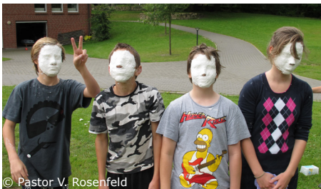
Konfirmandenfreizeit in Oese

und mit kreativen Methoden etwas über die Kraft von Zusammenhalt und Gemeinschaft. Jeder lernt, seinen