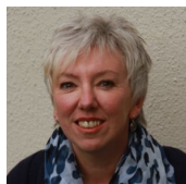
Claudia Woltmann Verwaltung Schuldnerberatung Bahnhofstraße 7 27432 Bremervörde 04761 / 9935-20