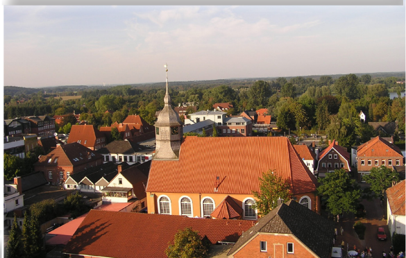
Neuer Pastor in St. Liborius