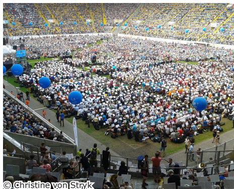
Dt. Ev. Posaumentag in Dresden