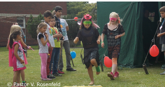
Sommerfest 2016