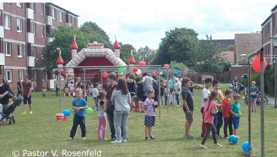
© Pastor V. Rosenfeld Sommerfest 2016