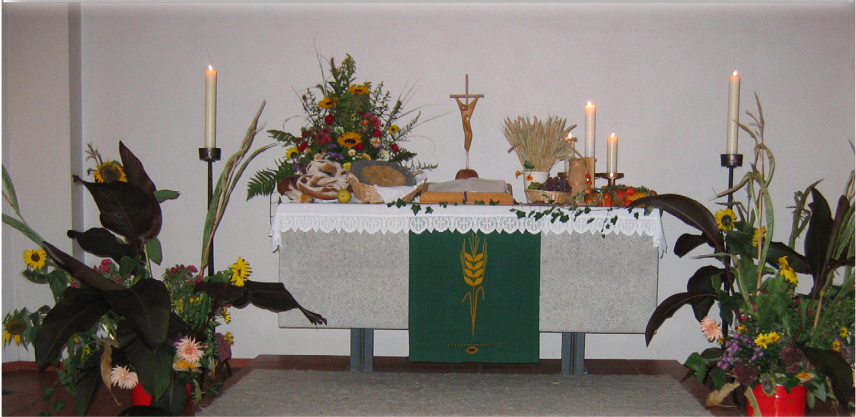
Auferstehung - Erntedankgottesdienst

Informationen der evangelisch-lutherischen Auferstehungskirche und St.-Liborius-Gemeinde in Bremervörde