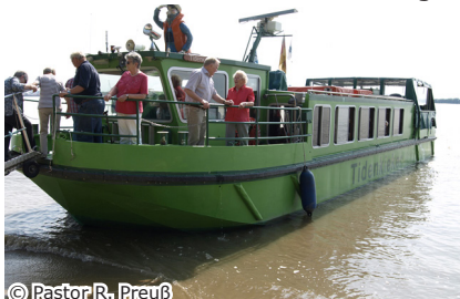
Fahrt mit dem Tidenkieker

Nach einer leckeren Stärkung konnten wir zum Höhepunkt des Ausflugs starten.