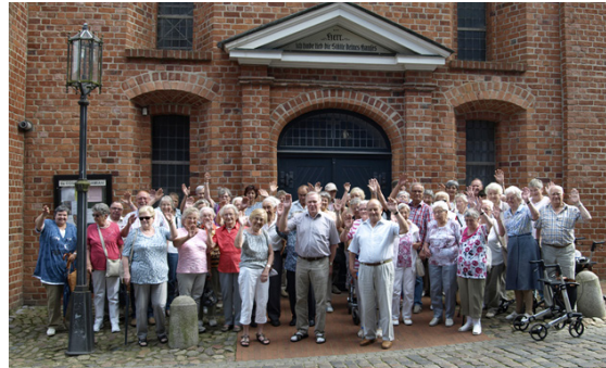
Tagesausflug nach Stade 2016

Am 6. Juni starteten wir zu unserem Ausflug nach Stade. Mit 48 Personen war der Bus voll besetzt. Bei gutem Wetter ging es zunächst nach Stade zum Alten Hafen. Von dort war die Altstadt gut zu Fuß zu erreichen. Es war Zeit für einen Spaziergang und ein Wiedersehen mit den historischen Kirchen und schönen Straßenzügen. Zum Mittagessen war der Stader Ratskeller für uns reserviert.