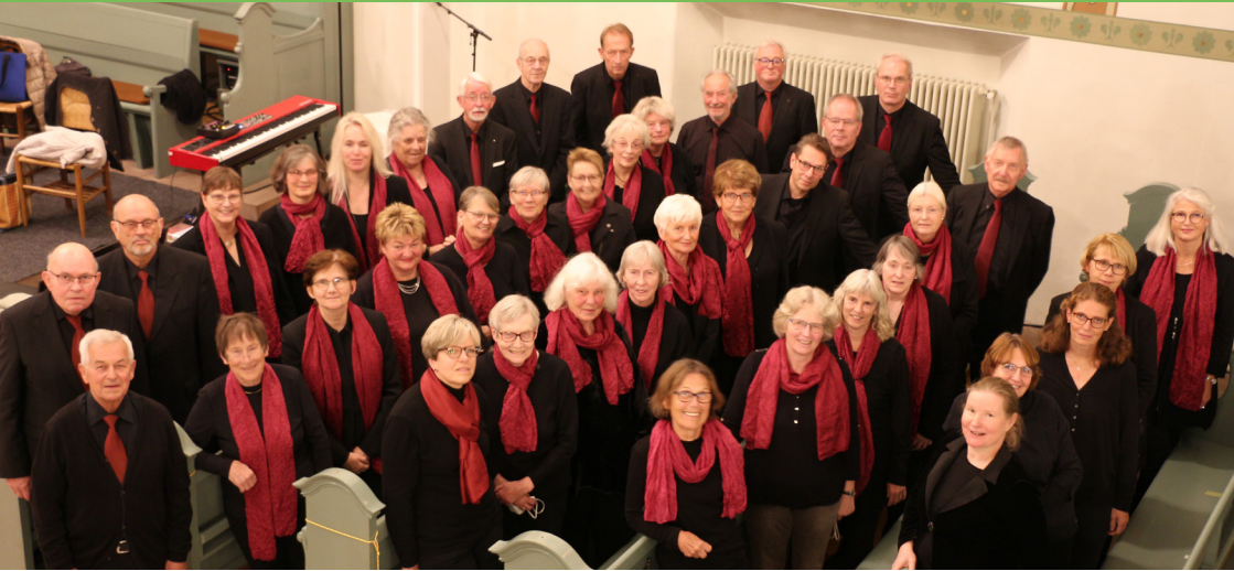
SängerInnen der Kantorei St. Liborius