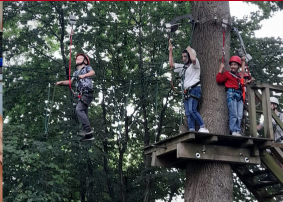
Alle hatten viel Spaß beim Zubereiten der Leckereien und beim Klettern in luftiger Höhe