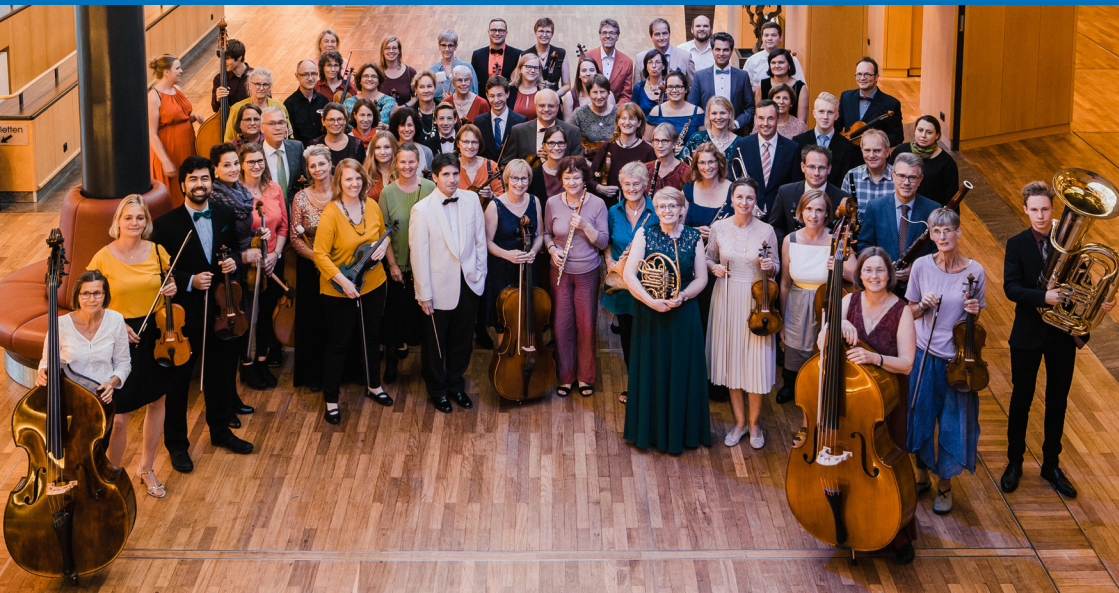
Das Stader Kammerorchester