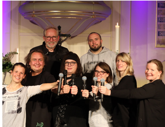
Die Band „Water+Wine“

Da vier verschiedene Formationen das Programm mitgestalten, ist Abwechslung garantiert. Karten zum Preis von 12.00 Euro und 8.00 Euro sind im Vorverkauf im Kirchenbüro und in der Buchhandlung Morgenstern erhältlich.