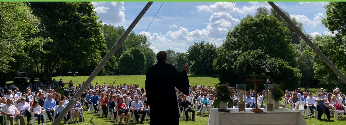
Ein gelungener Gottesdienst unter freiem Himmel bei bestem Wetter