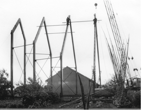
Bau der Kirche 1970