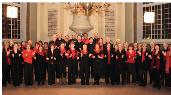
Gospelchor „Joyful Voices“