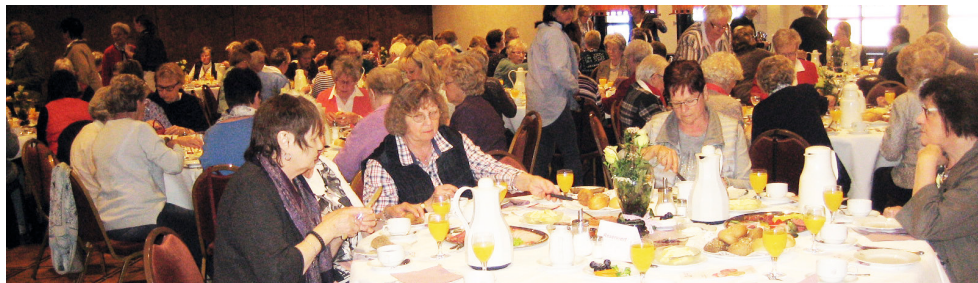
Frühstückstreffen für Frauen am 18. April 2015 in Bremervörde

Kommt es uns nur so vor, dass die Zeit so schnell vergangen ist?